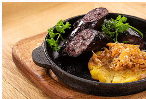
Himmel un Ääd